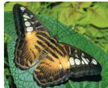
Parthenos sylvia Clipper