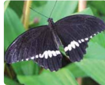
Papilio polytes Voilier mormon