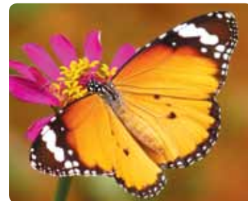
Danaus chrysippus Petit monarque