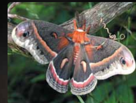
Hyalophora cecropia Saturnie cécropia