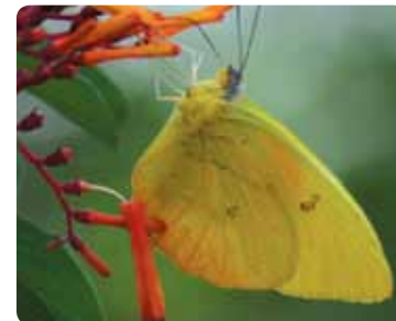
Phoebis philea Soufré géant