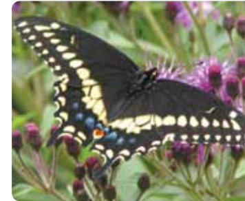
Papilio polyxenes Papillon du céleri