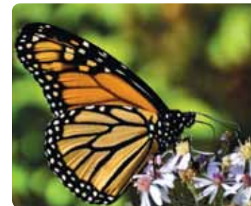
Danaus plexippus Monarque