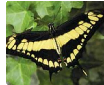
Papilio thoas Porte-queue thoas