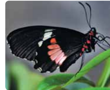
Parides iphidamas Voilier iphidamas