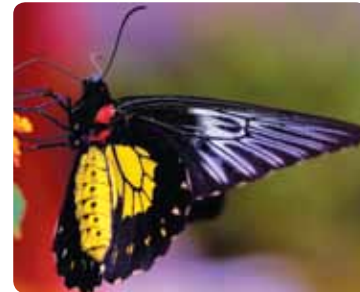
Troides rhadamantus Troïdes rhadamantus