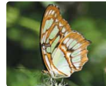
Siproeta stelenes Malachite