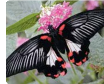
Papilio rumanzovia Porte-queue écarlate