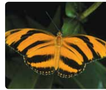
Dryadula phaetusa Dryadula phaétusa