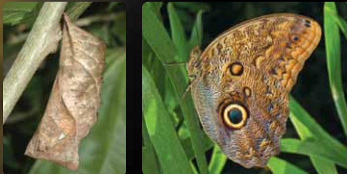
Caligo sp. • Papillon-chouette