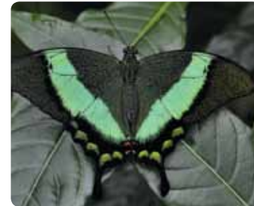
Papilio palinurus Machaon émeraude