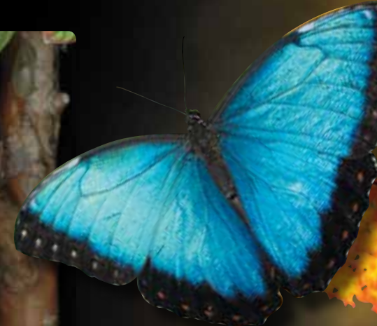
Morpho helenor Morpho bleu