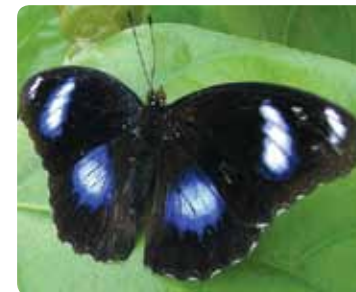
Hypolimnas bolina Bolina