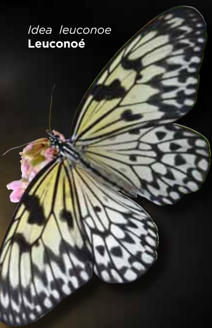
Idea leuconoe Leuconé