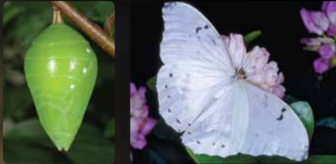
Morpho polyphemus • Morpho blanc