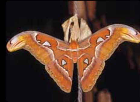
Attacus atlas • Papillon cobra