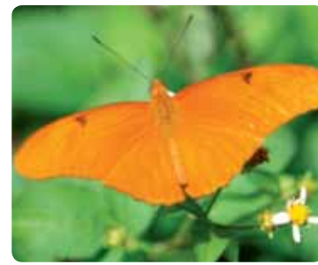
Dryas julia Flambeau