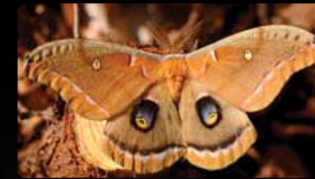
Antheraea polyphemus Polyphème d'Amérique