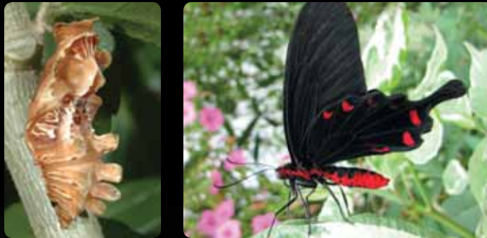
Pachliopta kotzebuea • Voilier kotzébuea