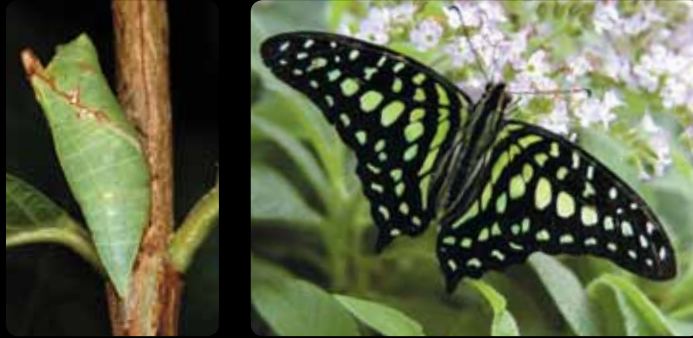
Graphium agamemnon • Porte-queue geai