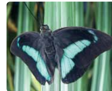
Archaeoprepona demophon Lueur bleue