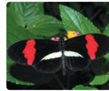
Heliconius melpomene Facteur