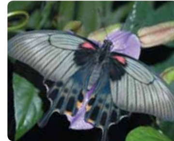
Papilio lowi Porte-queue d'Asie