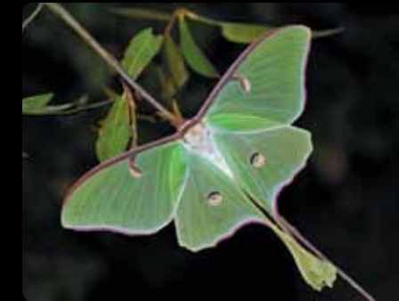
Actias luna Papillon lune