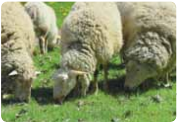
Des moutons au Jardin