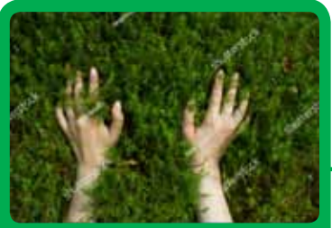
L'Odysée des plantes Parcours de découverte en 8 stations