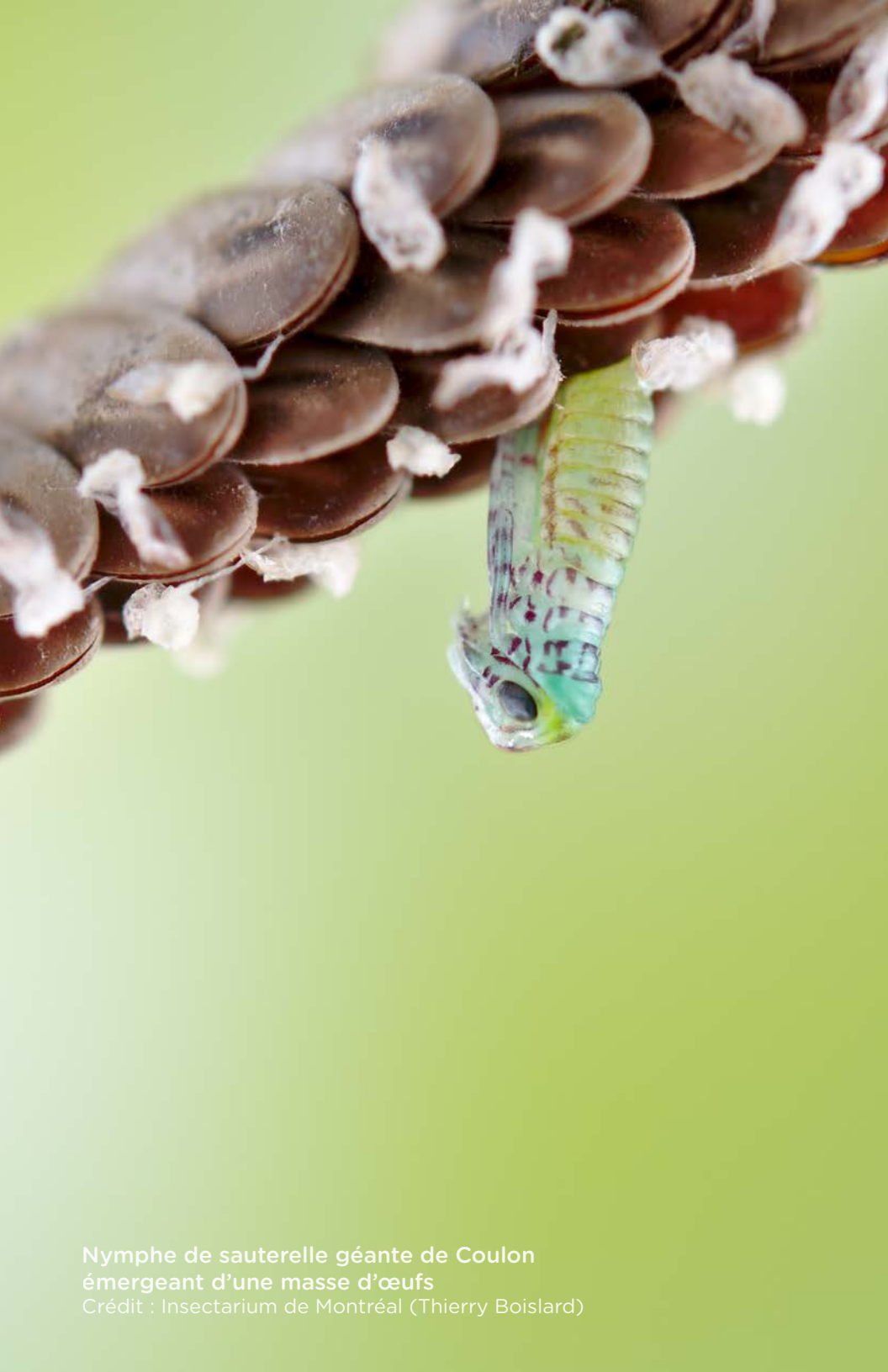
Nymphe de sauterelle géante de Coulon émergeant d'une masse d'œufs