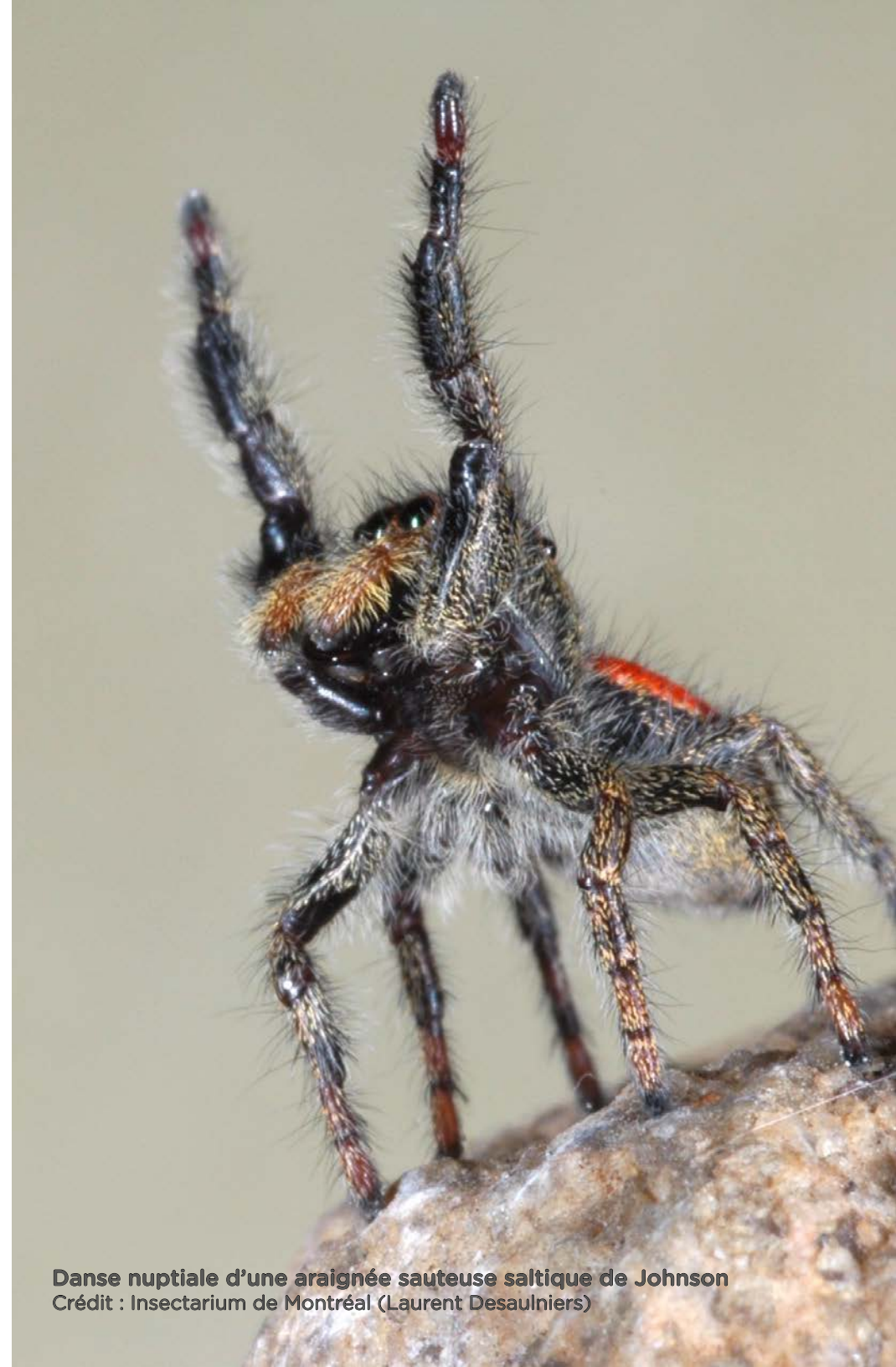
Danse nuptiale d'une araignée sauteuse saltique de Johnson