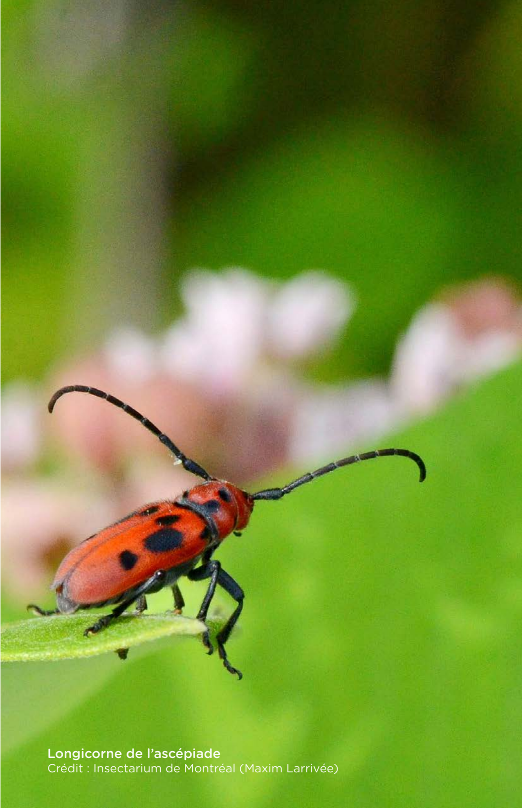
Longicorne de l'ascépiade