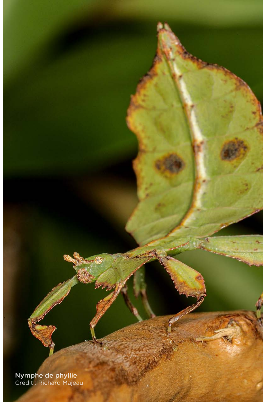
Nymphe de phyllie

Un soutien pour la diffusion de l’œuvre est également prévu, mais ne fait pas partie de ce programme (voir précisions à la page 8).