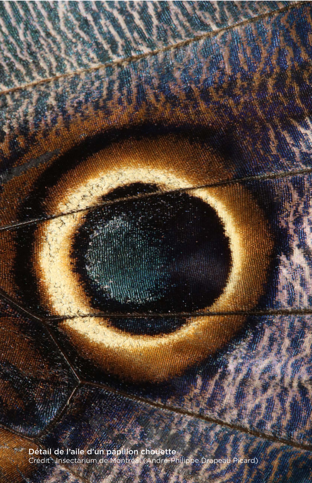
Détail de l'aile d'un papillon chouette