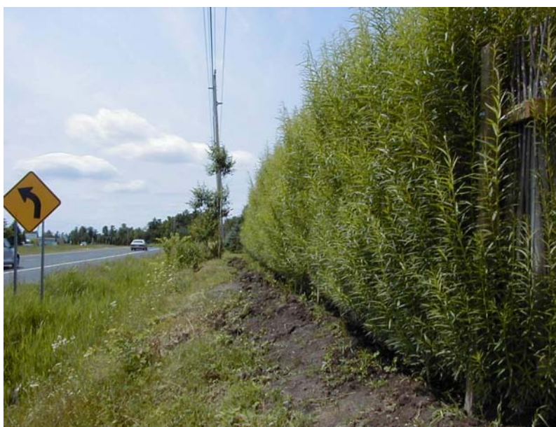
Figure 2. Mur végétal réalisé à Saint-Bruno, six semaines après sa mise en place.

Ceci nous a également permis de réaliser que les murs faits de végétaux peuvent non seulement être érigés en bordure de route et répondent à des préoccupations liées au transport mais qu'ils peuvent aussi être envisagés pour de multiples autres scénarios. On les imagine ainsi aux alentours de zones industrielles, de dépotoirs, de terrains de golf, le long de pistes cyclables, en bordure des gares, des cours d'école, le long des voies ferrées, etc. Leur utilisation est donc pratiquement illimitée puisqu'on peut adapter cette structure selon les situations ou l'espace disponible. Les murs faits de végétaux pourraient donc intéresser une clientèle fortement diversifiée.